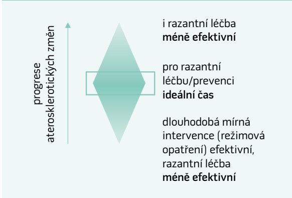
Schéma 1. Optimální časování léčby aterosklerotických změn