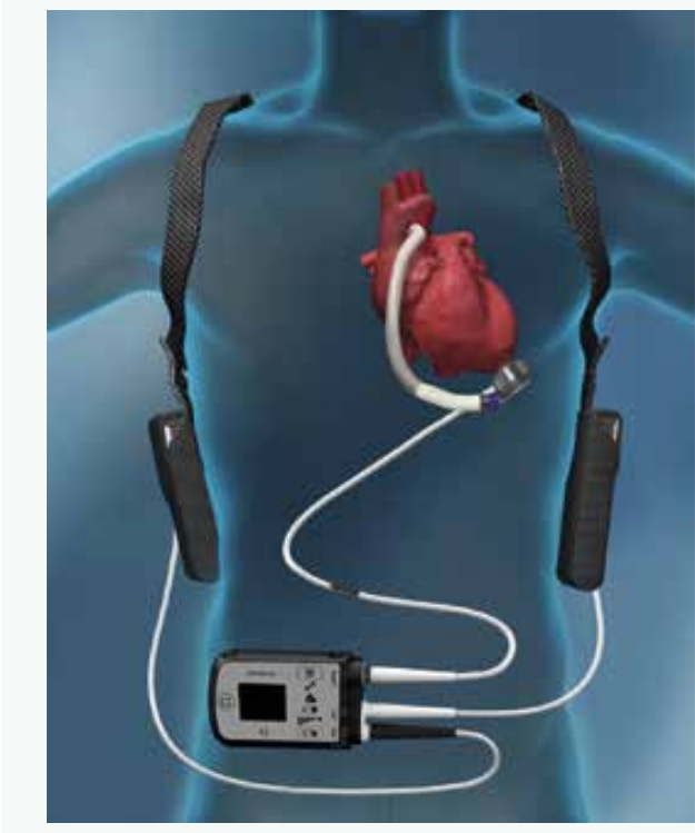
Obr | Mechanická srdeční podpora HeartMate 3 (použito se svolením společnosti Abbott U.S.)