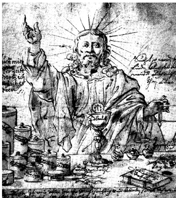
Obr. 1. Kristus jako lékárník

Antické ochránce zdraví a patrony zdravotníků, boha Asklépia a jeho známější dcery Hygieiu a Panakeu, vystřídal v křesťanské éře Bůh otec, ale především jeho syn Kristus jako nebeský léčitel duší a ochránce lékařů a lékárníků, strážců zdraví a léčitelů nemocných živých těl. K ruce mu byli křesťanští světci Pantaleon, Rochus, Šebestián, ale zejména bratři Kosma a Damián. Ti poslední působí v roli symbolických patronů našich