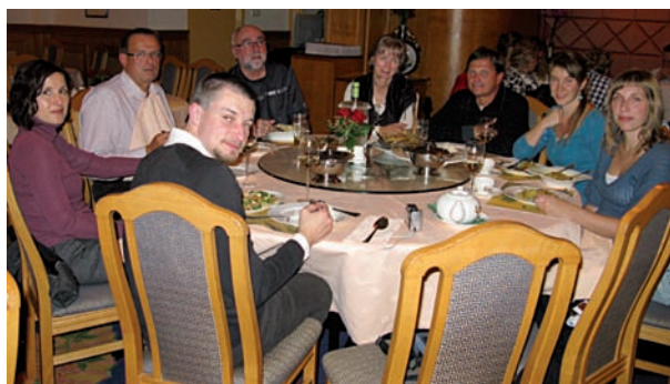
Společná večeře české reprezentace

Českou republiku zastupovalo na kongresu 14 farmaceutů z Výboru ČFS, ČLK, pedagogové i studenti DSP