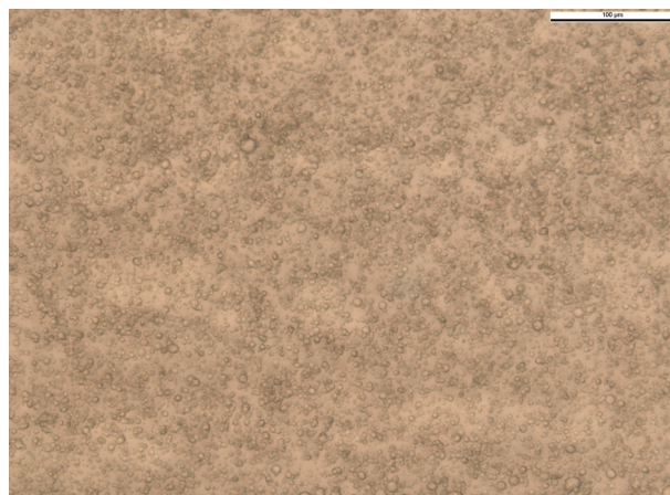
Obr. 4. Lidokainový emulgel s 5 % lidokainu, 0,6 % thymolu, s 3 % trometamolu (90. den od přípravy, zvětšení 400x)