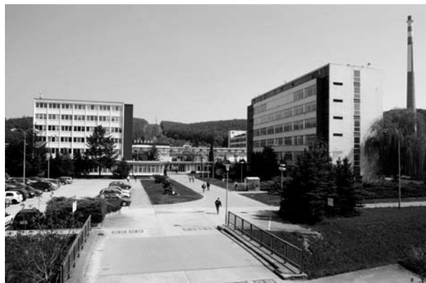
Obr. 5. Administrativní budova a Výzkumný ústav před likvidací firmy 9 )

násobku průměrné měsíční mzdy dle délky zaměstnání ve firmě 32 ). Drobní akcionáři, převážně z řad bývalých zaměstnanců, pak prodali své akcie většinovému vlastníkovi. Hospodaření Lachemy v roce 2008 skončilo historicky nejvyšší a poslední ztrátou ve výši 405 milionů 33 ) (graf 1).