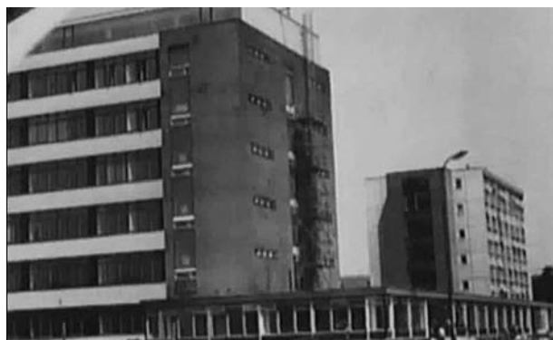
Obr. 1. Výstavba výzkumného ústavu a administrativní budovy

Původně byl podnik zaměřen na adjustaci čistých a speciálních chemikálií a nacházel se v Brně v Poděbradově ulici. Již v padesátých letech se ovšem Lachema stala předním výrobcem analytických činidel, indikátorů a barviv pro mikroskopii, stejně jako cukrů, aminokyselin a celé řady dalších chemikálií. Roku 1958 byl závod Lachema včleněn do národního podniku Spolana Neratovice, ale již v roce 1963 byla její činnost obnovena pod hlavičkou Výzkumného ústavu čistých chemikálií (VÚČCH), zřízením detašovaného pracoviště v budově Chemické fakulty Vojenské akademie na Žižkově ulici. Vznikly tak podmínky pro výzkum a vývoj v různých oblastech chemických specialit a za tímto účelem byl vybudován samostatný podnik v Brně Řečkovičích 2) .