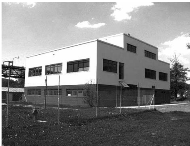
Obr. 3. Nový pavilon jakosti 20

Celkově po vlastnictví Chemapolu došlo ke stagnaci prodeje na úrovni přibližně 1 miliardy korun ročně, což vytvořilo velké ztráty a došlo k propadu Lachemy do červených čísel. Lachema je nucena přijmout pomoc od Plivy, ovšem, podle některých komentářů, s velkou mírou úrokových splátek 12 .