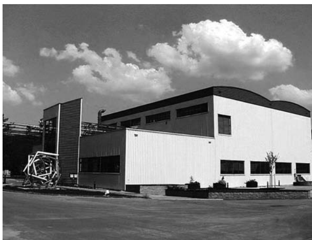
Obr. 4. Výrobna cytostatických injekcí 20