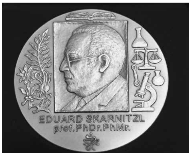
Obr. 3. Medaile Eduarda Skarnitzla