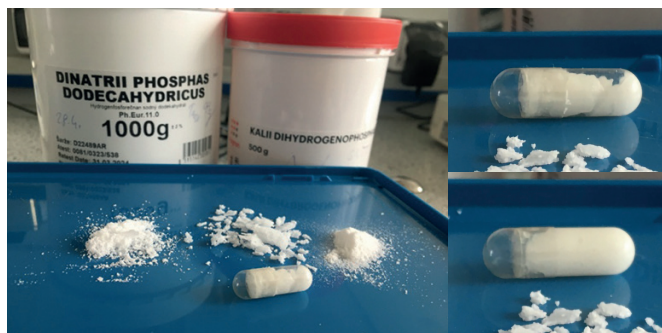
Obr. 1. Ztekucení směsi NaHPO 4 · 12H 2 O (0,36g) + KH 2 PO 4 (0,602 g)

Připravují se samostatně tobolky se sodnou solí (100 ks) a samostatně tobolky s draselnou solí (100 ks). Pacient tedy dostane dvoje ideálně barevně odlišné tobolky a užívá dvojnásobné množství (tedy 2–3x denně 1 + 1 tobolka).