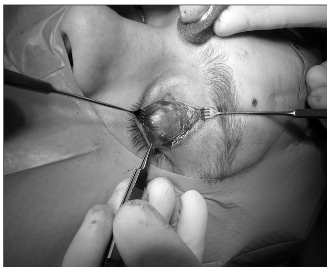
Obr. 4. Preparace podkoží horního víčka

optimální, pokud je fixován co nejnižše k tarzální ploténce. Po stabilizaci implantátu a kontrole jeho uložení adaptujeme operační ránu po jednotlivých vrstvách. Výkon končí krytím sterilním obvazem a aplikací lokálních antibiotik (obr. 3 až obr. 10).