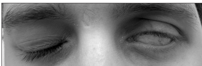
Obr. 1.2. Lagoftalmus při snaze uzavřít oční štěrbinu (House-Brackmann skóre V)