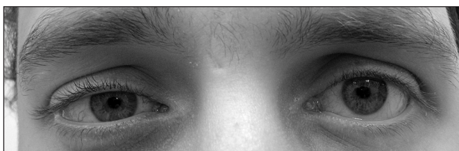
Obr. 1.1. Levostranná retrakce horního víčka u obrny n VII