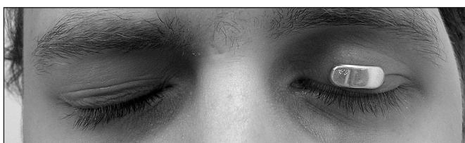
Obr. 1.3. Redukce lagoftalmu zlatým implantátem