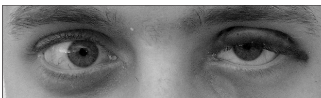
Obr. 1.4. První pooperační den s implantátem v horním víčku