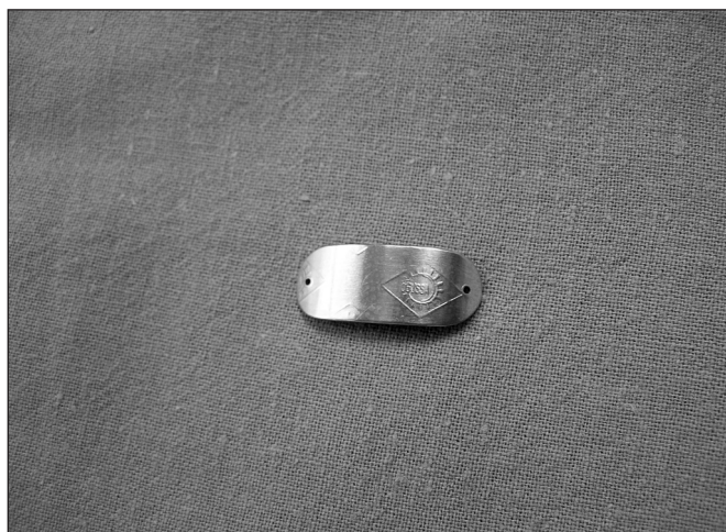
Obr. 2. Zlatý implantát – na bocích otvůrky pro zavedení stehů

Operační řez je veden v orbitopalpebrální rýze 7 až 11 mm nad margem horního víčka v délce cca 1,5 cm. Po otevření kůže a podkoží následuje preparace svěrače víčka a mobilizace přední plochy tarzální ploténky. Tarzální ploténku horního víčka obnažíme směrem dolů až k okraji víčka. Implantát fixujeme symetricky na 2 místech k přední ploše tarzální ploténky cca do 1 až 2/3 její tloušťky. Poloha implantátu je