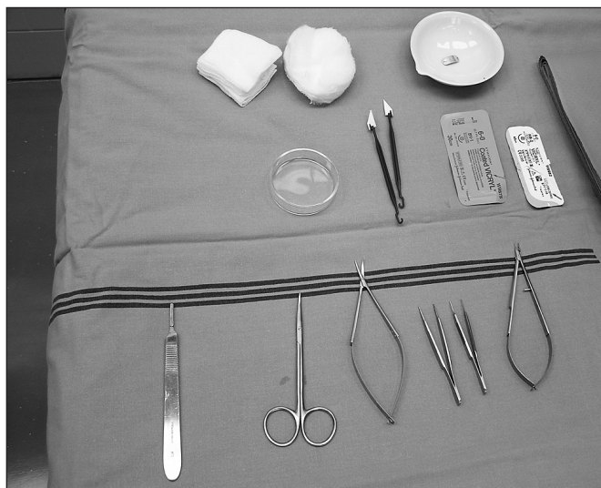
Obr. 3. Operační stolec připravený pro implantaci