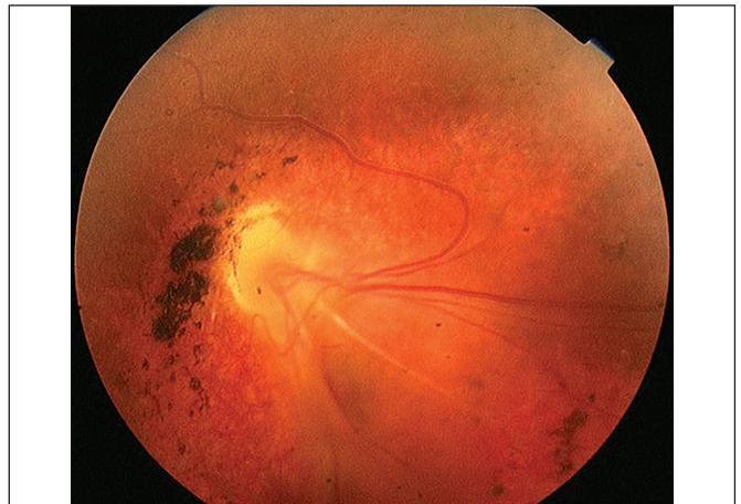
Obr. 2. Distortie celé sítnice