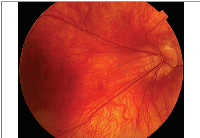
Obr. 1. Distortie makuly