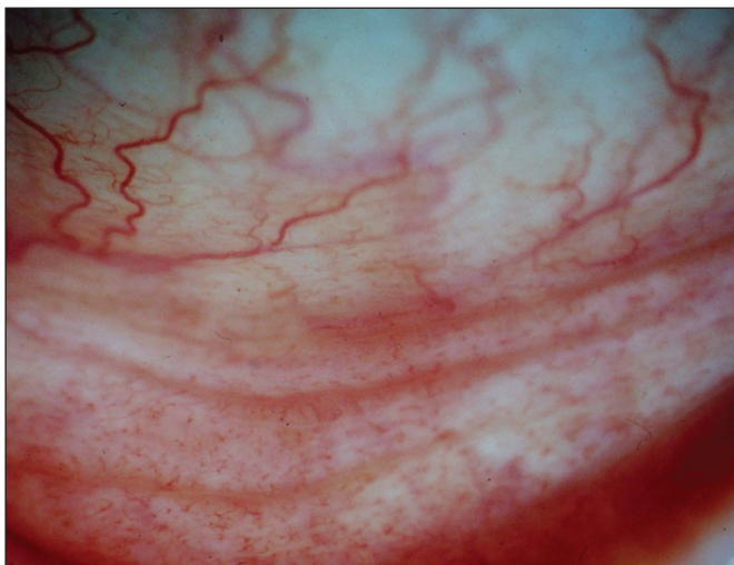
Obr. 2a. Jizevnaté změny spojivky v dolním fornixu před léčbou CP