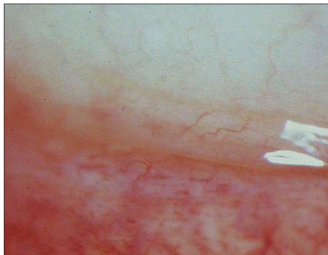
Obr. 1b. Ústup nálezu po 6 letech od ukončení léčby Cp makrolidy