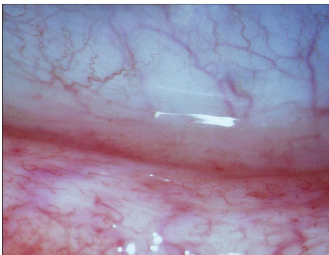
Obr. 1a. Hyperémie, prosáknutí s vinutostí cév dolního fornixu před léčbou Cp