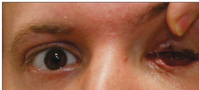
Obr. 3. Posttraumatický anoftalmus vlevo (5. den po úrazu)

Levé oko: porušený dolní slzný kanálek, tržná rána v bulbární spojivce délky 2 cm se zaschlou krustou, bez výrazného krvácení, patrná čtyři místa vbodnutí vidličky na horní mediální straně očníce, posttraumatický anophthalmus, hematoorbita.