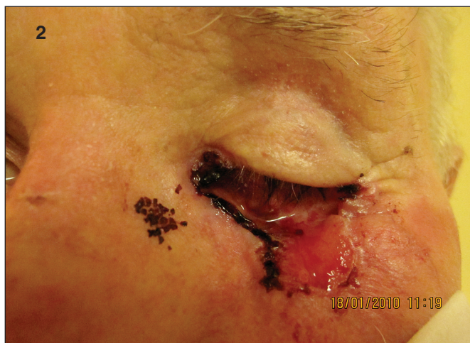
Obr. 2. Bazalióm T3