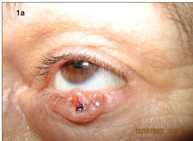
Obr. 1a. Pacientka s bazaliómom T2 pred liečbou