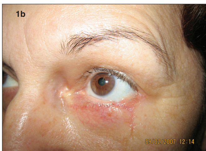
Obr. 1b. Pacientka po excízií bazaliómu T2 spodnej mihalnice