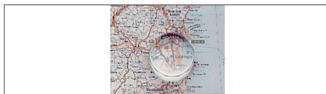
Obr. 7. Príložná lupa

Na základe analýzy získaných výsledkov sme zistovali a posudzovali efektívnosť predpisovania optických pomôcok na kompenzáciu ZP u detí.