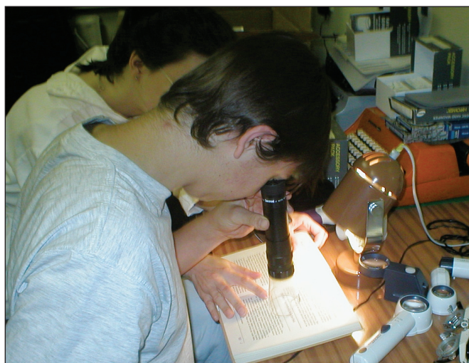
Obr. 3. Teleskop s príložnou lupou