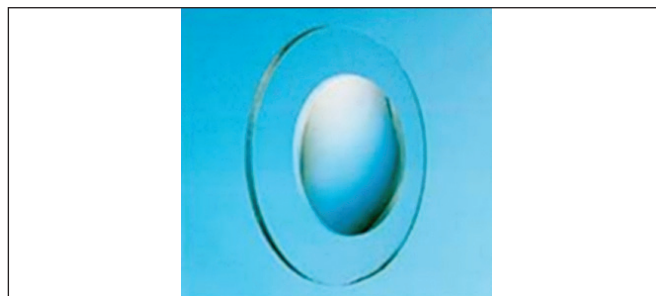
Obr. 4. Hyperokulár

podľa WHO a ICD-10 [9] v závislosti od binokulárnej ZO a duálnej klasifikácie príčin ZP podľa postihnutej anatomickej časti a podľa časového faktora, kedy k tomuto postihnutiu došlo tak ako navrhol Gilbertová [4]. Pri spracovaní sme použili metódy deskriptívnej štatistiky a párový t-test.