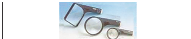
Obr. 6. Ručná lupa