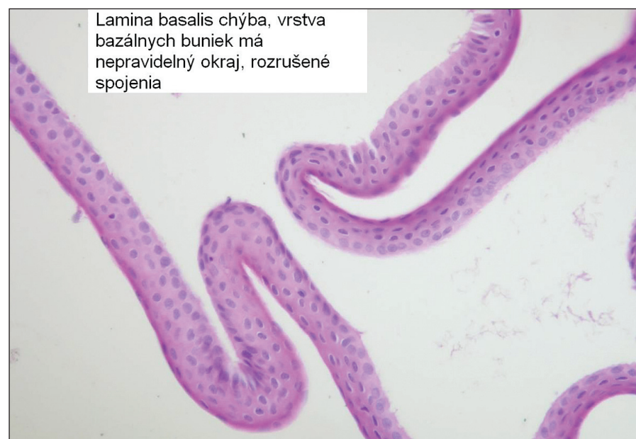
Obr. 2. Epitelíálny flap vytvorený s pomocou alkoholu, lamina basalis nie je prítomná