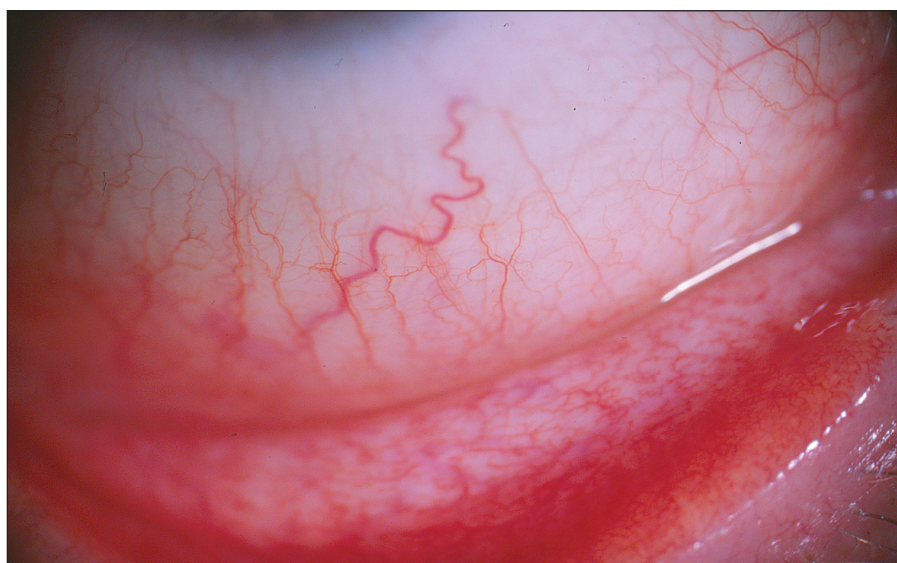
Obr. 2. Pacient č. 1: střední klinický nále z – zduření dolního fornixu s mírnou vinutostí cév bulbární spojivky a náznakem hyperémie

Folikulární záně t etiologie Ch. pneumoniae jsme léčili celkově podávaným makrolidovým (azalidovým) antibiotikem azithromycinem v dávce 500 mg denně po dobu 12 dní. (Oční infekci etiologie Ch. trachomatis jsme léčili stejným antibiotikem po dobu 7–9 dní, současně byl azithromycin 500 mg po dobu tří dnů podáván i sexuálním partnerům těchto pacientů.) U všech léčených osob byl kontrolní stěr ze spojivky tři měsíce po léčbě negativní, ale sérologický nále z se po šesti měsících od ukončení léčby téměř nezměnil. Po léčbě byl redukován nále z prosáknutí dolního fornixu s částečným ústupem hyperémie spojený současně s ústupem patologické sekrece. Subjektivní obtí že (řezání, pálení či pocit cizího tělí ska) provázené přechodnou hyperémií bulbární i tarzální spojivky přetrvávaly, ale byly menšího rozsahu, neboť