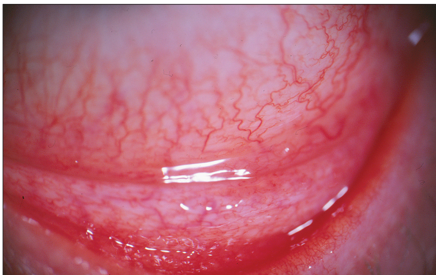
Obr. 3. Pacient č. 5: střední klinický nález – výrazné zduření dolního fornixu s folikuly dolního tarzu doprovázené vinutostí cév bulbární spojivky a hyperémií

O možnosti konjunktivitid etiologie Chlamydia pneumoniae se zmiňuje práce publikovaná před dvaceti pěti lety, ve které autoři referují o folikulární konjunktivitidě bez známek keratitidy [12], ke které patří obraz minimální mukopurulentní sekrece [7]. Chlamydia pneumoniae může dlouhodobě přetrvávat v organismu v makrofázích, které mohou být vektorem jejich šíření v organismu [45]. S variabilními výsledky byla DNA Chlamydia pneumoniae prokázána v periferních leukocytech u pacientů s ICHS [4] a v aterosklerotických plátech [5], kdy se předpokládá společné působení infekčního agens a žírných buněk v produkci cytokinů a matrix degradující metaloproteináz [8]. Pozitivní nález DNA Chlamydia pneumoniae v periferních leukocytech jsme zaznamenali rovněž u dvou našich pacientů s akutní formou folikulární konjunktivitidy a u jednoho nemocného s významně pozitivním sérologickým nálezem svědčícím pro dlouho trvající infekci v možném spojení s Chlamydia trachomatis .