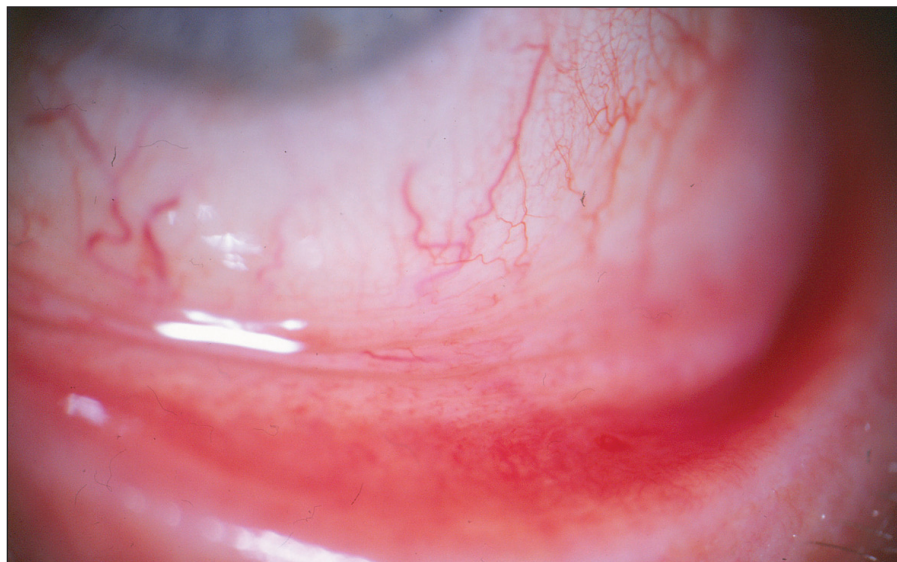
Obr. 1. Pacient č. 9: minimální klinický nále z – náznak hyperémie, vinutosti cév bulbární spojivky a zduření dolního fornixu