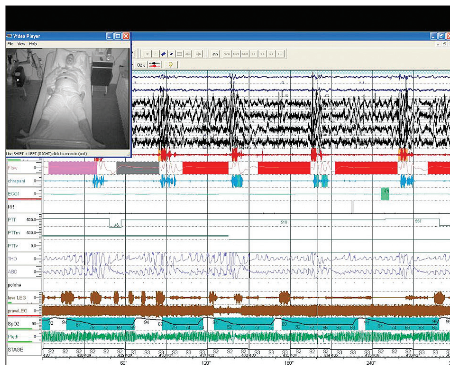
Obr. 7. Pětiminutová část záznamu videopolysomnografie – v levém rohu záznamu je na obrazovce pacient, který je snímán kamerou v infračerveném světle. První dva řádky jsou záznam EOG, níže pak záznam EEG (zvýrazněné červené čáry značí mikroproubouzení). Následuje řádek průtoku vzduchu (flow) s patrnými zástavami dechu – apnoickými pauzami (červeně značené obdélníky). Mezi apnoickými pauzami je modře značeno chrápání. V dolní části záznamu je modrozeleně zvýrazněn pokles saturace krve kyslíkem – patrný pokles až na 62 % SO_2 .

Diagnostika vychází z anamnestických údajů a dotazníkového šetření s kvantifikací denní spavosti a následného polysomnografického vyšetření ve spánkové laboratoři v průběhu nočního spánku. Zlatým standardem a nejpřesnějším vyšetřením je plná polysomnografie (PSG). Při tomto vyšetření probíhá navíc paralelní záznam elektroencefalografie (EEG), elektromyografie (EMG) a očních pohybů – elektrookulografie (EOG), které napomáhají k určení fáze spánku. Současně jsou registrovány a nahrávány dýchací zvuky a pacient je snímán ve spánku videokamerou v infračerveném osvětlení (obr. 7). Při polysomnografii je možnost, na rozdíl od limitované polygrafie, zaznamenat mikroproubouzení (32).