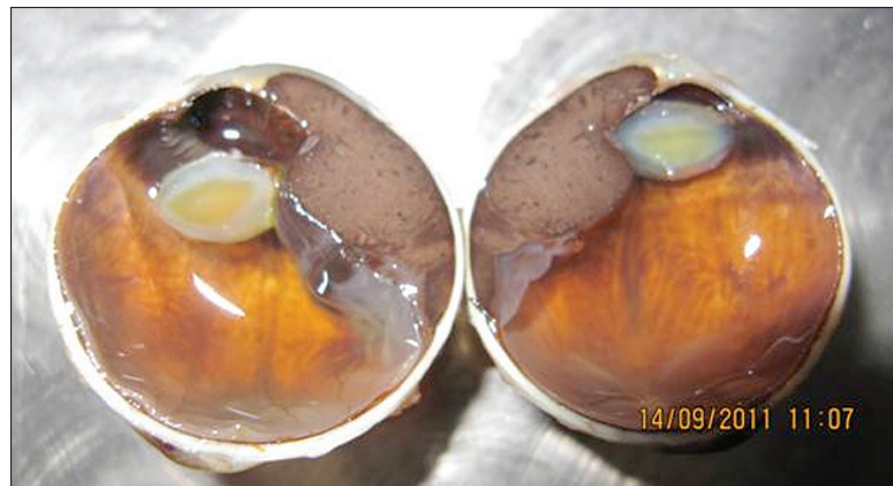
Obr. 1. Malígný melanóm corpus ciliare v štádiu T3N0M0 so sublúxiou šošovky a pre-rastaním do prednej očnej komory

Okrem veľkosti ovplyvňuje prognózu aj tvar nádoru (obr. 1). Za agresívnejšie sa považujú difúzne formy rastu MMU, a v prípade MM dúhovky a corpus ciliare tiež prstencový rast nádoru.