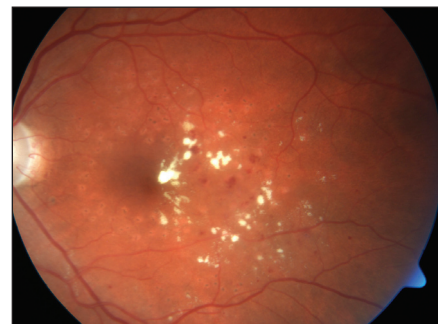
Obr. 1. KSME – při zahájení mřížkové foto-koagulace

V časně arteriální fázi je možno velmi přesně identifikovat FAZ, jejíž rozšíření a nepravidelný tvar je signifikantní pro počáteční diabetickou makulopatii. Současně jsou patrné ektaticky změněné napřímené kapiláry, které mnohdy naznačují oblasti budoucí ischemie. Později může být patrné zbarvení – staining kapilár, který signalizuje poruchu hemato-okulární bariéry, která následně přechází do edému. Difúzní, zvolna narůstající hyperfluorescence makulárního edému, mívá v pozdních fázích