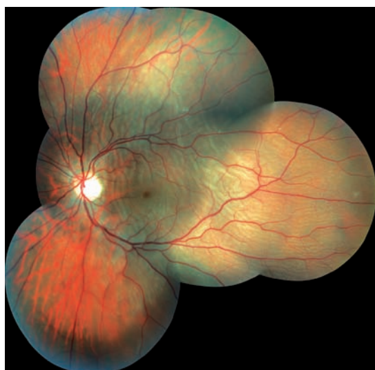
Obr. 1 Kvadrantová amoce zasahující centrální krajinu.

Indicie k provedení operace amoce zevním postupem byly téměř ve všech případech obdobné: mladý pacient s čirou vlastní čočkou, nález lokální nefixované amoce, jasně patrná primární patologie, krát-