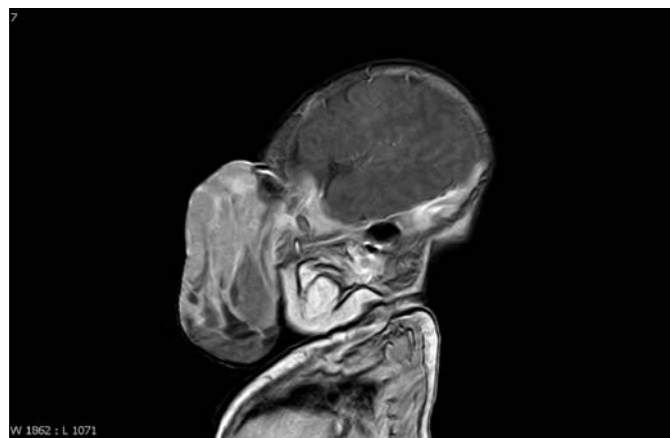
Obr. 11. MR mozku – 29. den po narození.