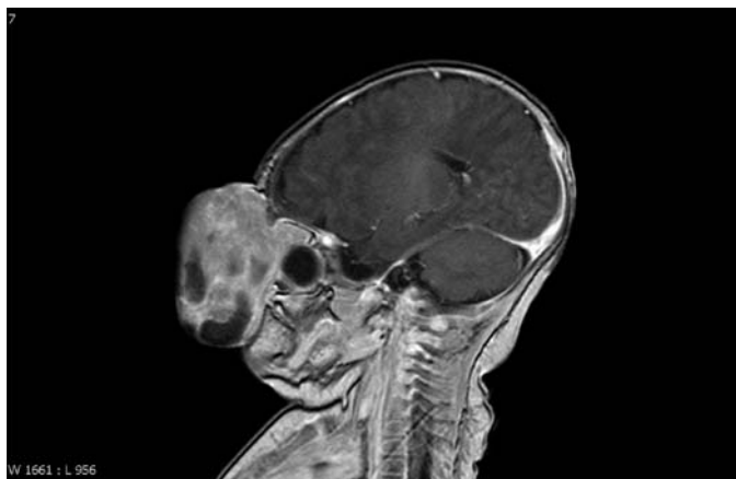
Obr. 10. MR mozku – 22. den po narození.