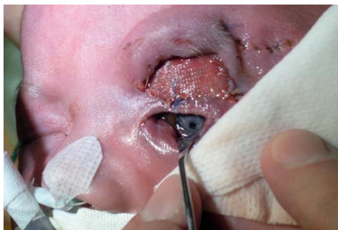
Obr. 5. Stav 2. den po operaci.

Proto jsme nasadili adekvátní terapii pro hemangiom – perorální léčba propranololem a kortikoidy. Pro progresi útvaru byl aplikován DepoMedrol 40 mg inj. do útvaru, 3 bolusy SoluMedrolu i.v. a byla zahájena salvage terapie pro děti s rychle progredujícími hemangiomy (1x Avastin, 1x Taxol i.v.)