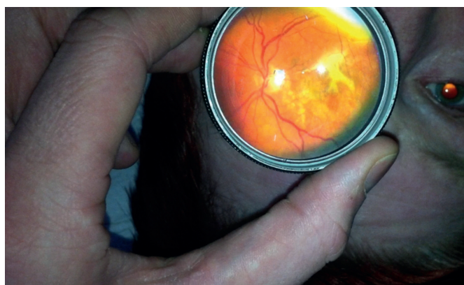
Obr. 3 Snímek centrální krajiny sítnice u 65letého pacienta s pokročilou formou věkem podmíněné makulární degenerace.