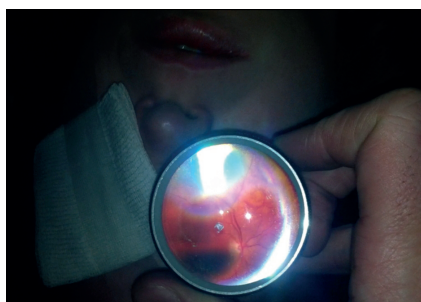
Obr. 5 a-b Učební křivka – snímky sítnice u 2 pacientů vyšetřených s odstupem měsíce: a – fyziologický nález na sítnici u 30leté ženy se strabismem (pořízeno v září 2013) b – snímek totální rhegmatogenní amoce sítnice u 64letého pacienta (pořízeno v říjnu 2013).