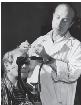
I. oční klinika v roce 1962