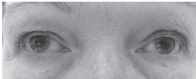
Obr. 1 Průměr zornice pravého oka byl před aplikací 1% fenylefrinu 5 mm, levého oka 3 mm (nahore). Hodinu po aplikaci 1% fenylefrinu se průměr zornice pravého oka nezměnil, na levém oku se zornice rozšířila a rovněž se zlepšil pokles horního víčka vlevo (dole). Výsledek testu ukázal na postganglionární lézi sympatiku vlevo

roztok fenylefrinu, který jsem si nechala připravit v lékárně nařazením 10% fenylefrinu (Neosynephrine-POS). Změřila jsem průměr zornice pravého a levého oka za stejných světelných podmínek před aplikací a jednu hodinu po aplikaci jedné kapky 1% roztoku fenylefrinu do spojivkového vaku obou očí. Před aplikací byl průměr zornice pravého oka 5 mm, levého oka 3 mm. Hodinu po aplikaci 1% fenylefrinu byl průměr zornice pravého oka 5 mm, levého 5 mm a rovněž se zlepšil pokles horního víčka vlevo (obr. 1). Výsledek testu ukázal na postganglionární lézi sympatiku vlevo.