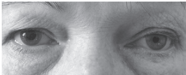
Obr. 2 Před aplikací kokainu měla zornice na pravém oku šířku 3 mm, na levém oku 2 mm (nahore). Hodinu po nakapání kokainu se pravá zornice rozšířila na 5 mm, průměr levé zornice se nezměnil (dole). Kokainový test potvrdil, že se jedná o Hornerův syndrom