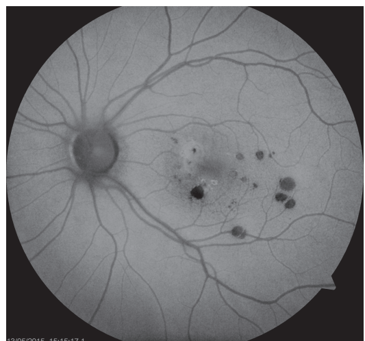
Obr. 6 Auto-fluorescenční fotografie očního pozadí oka levého. Ložiska atrofie RPE