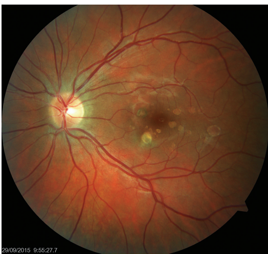
Obr. 5 Levé oko. Původní aktivní ložisko na sítnici se postupně ohraničuje a částečně pigmentuje