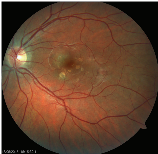
Obr. 1 Levé oko. Nález akutního zánětlivého ložiska v centrální krajině sítnice