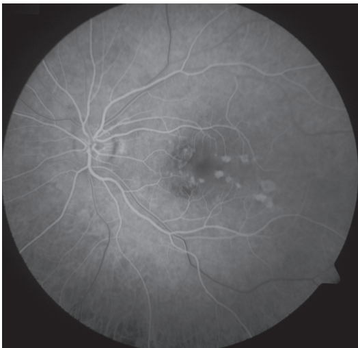
Obr. 3 FAG oka levého. Hyperfluorescence window defektů RPE v místě již neaktivních pozánětlivých lézí