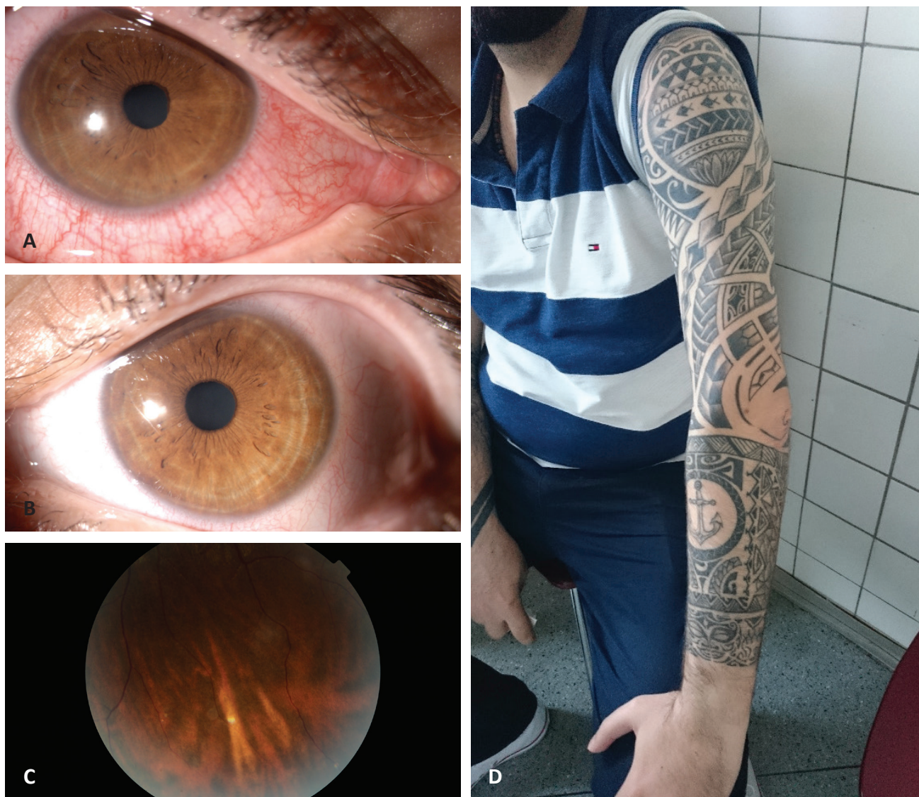
Obr. 2 Pacient č. 2

2a Smíšená injekce spojivky u přední uveitidy na OP