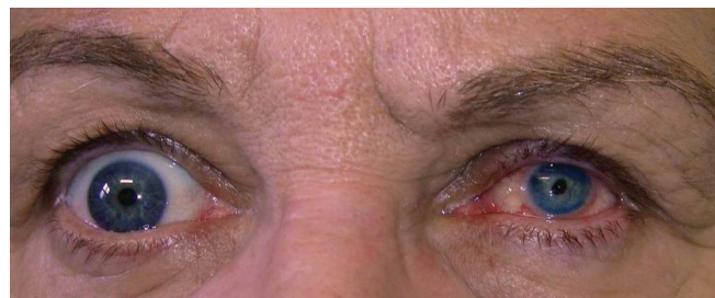
Obrázek 4 a 5. Pac. č. 2 pred a po zákroku KTP