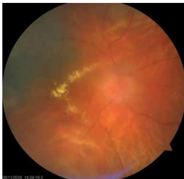
Obrázok 2. Pacient s postradiačnou optikoneuropatiou a makulopatiou

Na obrázku 3 a 4 je histopatologický nález recidivujúceho melanómu corpus ciliare u pacientky z nášho súboru