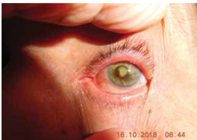
Obrázok 1. Pacient s postradiačnou kataraktou a neovaskulárnym glaukómom

rokov (33 %). Žien bolo 85 (51%) a mužov 83(49 %). Tumor na pravom oku malo 82 pacientov (49 %), na ľavom oku 86 pacientov (51 %). U 21 pacientov (12,5 %) vyrastal tumor z oblasti corpus ciliare, u 147 pacientov z chorioidey (87,5 %). Tumory lokalizované preekvatoriálne – teda vyrastajúce z corpus ciliare alebo z preekvatoriálnej časti chorioidey – malo 41 pacientov (24 %), z postekvatoriálnej časti chorioidey 127 pacientov (76 %). Priemerný objem tumoru pred ožiareníem bol 0,4402 cm 3 . Dávka ožiarenia na oblasť tumoru bola od 35,0 do 62,05 Gy, medián dávky 40,13 Gy.