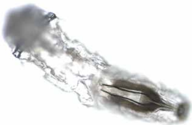
Obrázek 9. Larva Oestrus ovis z ventrálního pohledu (zvětšení 100x) s detailem vnitřních orgánů

mimo endemické oblasti, aby se zabránilo rozvoji mouchy v nových regionech, kde se dříve nevyskytovaly [7].