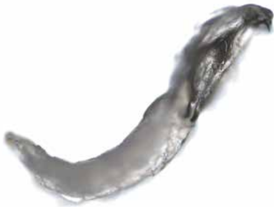
Obrázek 8. Larva Oestrus ovis z boku (zvětšení 100x) - dobře patrné oči a jeden háček