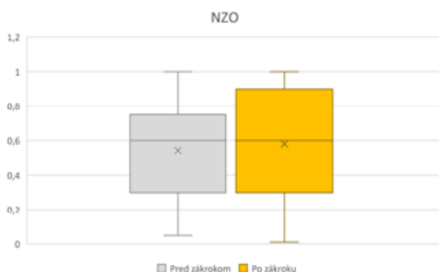
Graf 1. Zmena NZO pred operáciou a po operácii NZO – nekorigovaná zraková ostrosť

Výsledky vykazujú zmenu NZO 0,54 (Snellen) (0,267 logMAR) \pm 0,31 pred zákrokom a 0,58 (Snellen) (0,235 logMAR) \pm 0,34 po zákroku bez štatistickej významnosti (p = 0,371) (Graf 1) a NKZO 0,87 (Snellen) (0,06 logMAR) \pm 0,17 pred zákrokom a 0,89 (Snellen) (0,05 logMAR) \pm 0,18 po zákroku taktiež bez štatistickej významnosti (p = 0,938) (Graf 2). Taktiež boli pozorované zmeny zakrivenia prednej plochy rohovky – AIC S (pred 45,95 Dpt \pm 1,51 po 45,67 Dpt \pm 1,43), AIC F (pred 43,81 \pm 1,47, po 43,48 Dpt \pm 1,53) a AIC M (pred 44,89 Dpt \pm 1,4, po 44,57 Dpt \pm 1,35), ktoré vykázali štatisticky významnú zmenu v zmysle zníženia (p = 0,019; p = 0,010 a p = 0,005). Zmeny zakrivenia zadnej plochy rohovky PIC S (pred 6,99 Dpt \pm 0,58, po 7,04 Dpt \pm 0,54), PIC F (pred 6,26 Dpt \pm 0,35, po 6,27 Dpt \pm 0,33), a PIC M (pred 6,59 Dpt \pm 0,46, po 6,62 Dpt \pm 0,4) boli štatisticky nevýznamné