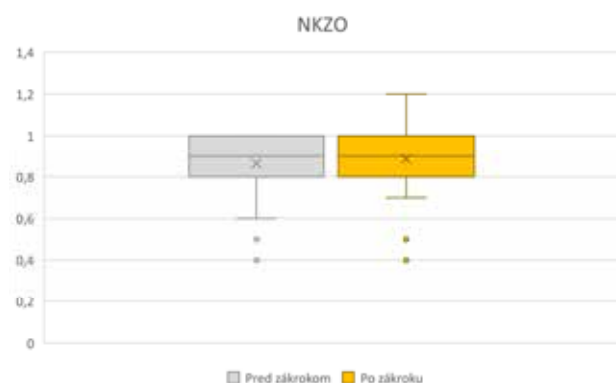
Graf 2. Zmena NKZO pred operáciou a po operácii NKZO – najlepšia korigovaná zraková ostrosť