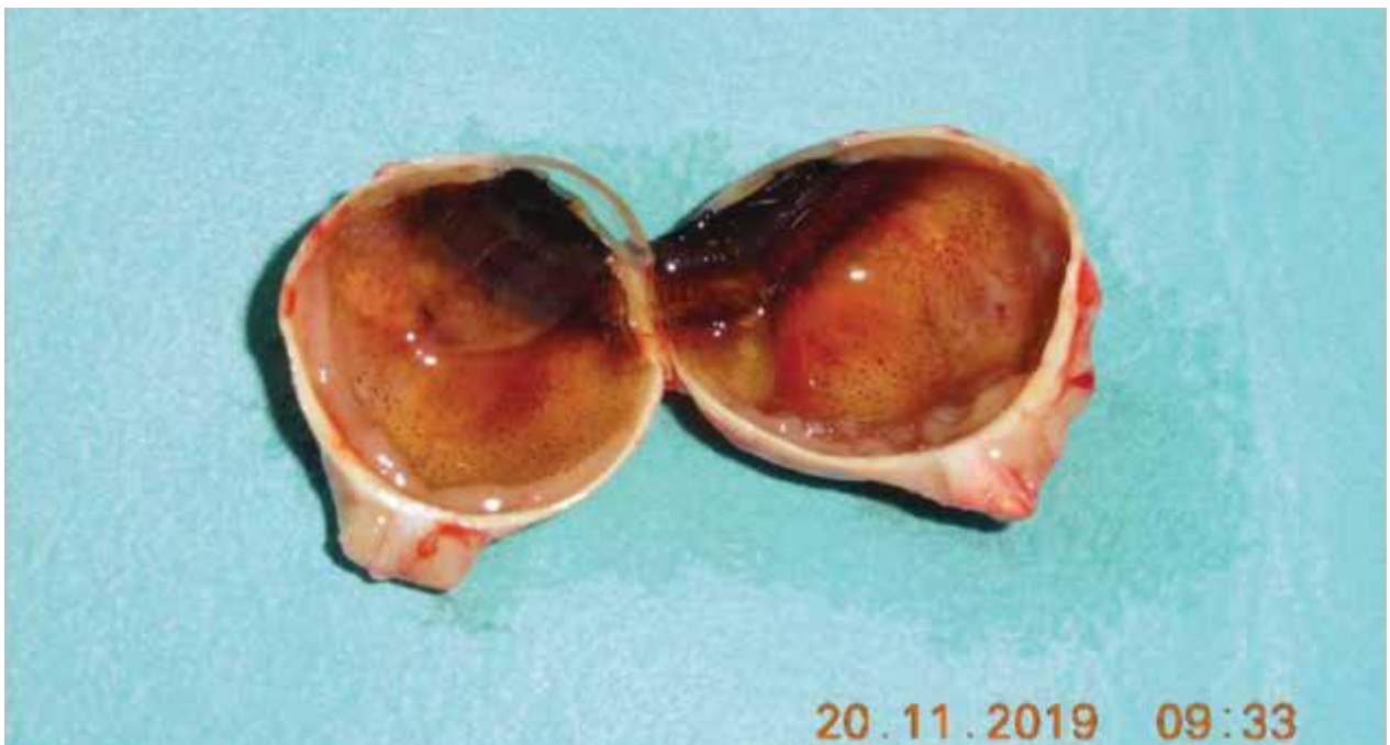
Obrázok 2.: Bulbus po enukleácii: intrabulbárna masa 2x1 cm s cirkulárnym prerastaním okolo zrkovného nervu

teľná amočná odozva vo všetkých kvadrantoch, odlúčenie choroidey, terč zrkovného nervu prekrytý tumorom, rozšírenie zrkovného nervu a negatívne echo v hrúbke 5mm. Magnetická rezonancia preukázala nepravidelné zhrubnutie steny ľavého bulbu, obraz plošného zhrubnutia choroidey do hrúbky 2,8 mm, prítomné retrobulbárne šírenie v okolí terča zrkovného nervu a iniciálneho úseku zrkovného nervu s rozmermi 14x5,5 mm a obraz plošnej amócie sietnice. Mozgový parenchým bol na magnetickej rezonancii intaktný. Vyšetrenie optickou koherentnou tomografiou nebolo možné zrealizovať, pacientka nefixovala ľavým okom. Fluoresceínová angiografia nebola realizovaná pre jednoznačný nález tumorózneho intraokulárneho ložiska s postihnutím iniciálneho úseku zrkovného nervu na ultrasonografii