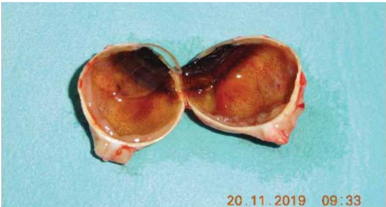
Obrázok 2.: Bulbus po enukleácii: intrabulbárna masa 2x1 cm s cirkulárnym prerastaním okolo zrakového nervu

teľná amočná odozva vo všetkých kvadrantoch, odlúčenie choroidey, terč zrakového nervu prekrytý tumorom, rozšírenie zrakového nervu a negatívne echo v hrúbke 5mm. Magnetická rezonancia preukázala nepravidelné zhrubnutie steny ľavého bulbu, obraz plošného zhrubnutia choroidey do hrúbky 2,8 mm, prítomné retrobulbárne šírenie v okolí terča zrakového nervu a iniciálneho úseku zrakového nervu s rozmermi 14x5,5 mm a obraz plošnej amócie sietnice. Mozgový parenchým bol na magnetickej rezonancii intaktný. Vyšetrenie optickou koherentnou tomografiou nebolo možné zrealizovať, pacientka nefixovala ľavým okom. Fluoresceínová angiografia nebola realizovaná pre jednoznačný nález tumorózneho intraokulárneho ložiska s postihnutím iniciálneho úseku zrakového nervu na ultrasonografii