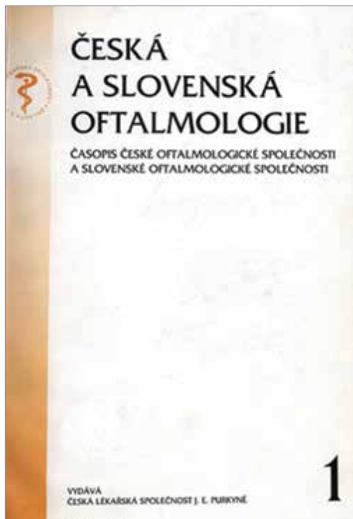
Obrázek 10. Česká a slovenská oftalmologie 1995;51(únor)

29. 4. 1949 se sešel výbor společnosti [17], Kurz informoval o nové situaci, která vznikla reorganizací Spolku českých lékařů. Byly probrány navržené stanovy a k jednotlivým bodům sděleny připomínky. Jelikož nové stanovy Spolku lékařů českých až dosud nebyly schváleny, bylo doporučeno jednotlivým společností, aby zatím neměnily svoji vnitřní strukturu, což však později bude nutné. Počet členů společnosti v roce 1949 (k 6. září) je 204 (Čechy 117, Morava 47, Slovensko 40).