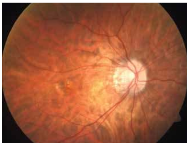
Obrázek 1. Fotografie sítnice pravého oka. Patrná pigmentovaná myopická choroidální neovaskulární membrána s drobnou hemoragií

Na kontrole v únoru 2020 byla NKZO stabilní, došlo ovšem k mírnému nárůstu edému a hyperreflektivního ložiska v makule, CRT byla 329 \mu m (Obrázek 2B). Po domluvě s pacientkou a ošetřujícím gynekologem byla indikována aplikace ranibizumabu do OP. Vzhledem k přítomnosti aktivní CNV v makule bylo také doporučeno vedení porodu císařským řezem (SC) pro riziko krvácení v makule při porodu vedeném přirozenou cestou. Před aplikací byla pacientka poučena o všech rizicích spojených s intravitreální aplikací ranibizumabu pro ni samotnou i pro plod. Pacientka tato rizika akceptovala a podepsala informovaný souhlas s intravitreální aplikací ranibizumabu. Aplikace proběhla ve 36. gestačním týdnu ve standardním režimu naší kliniky bez komplikací.