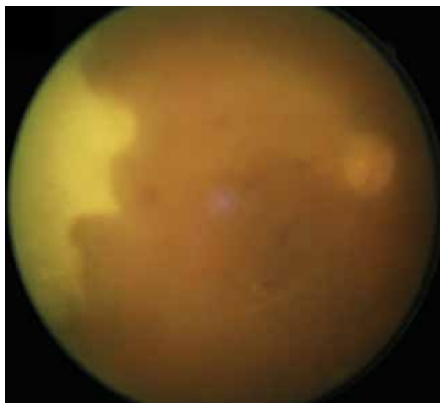
Obrázok 2. Fotografia očného pozadia pravého oka: pre zápalovú aktivitu v sklovci vidno matnejšie zneostrený zrakový nerv, okludované cievy, v temporálnom kvadrante žltobiele ložisko nekrózy