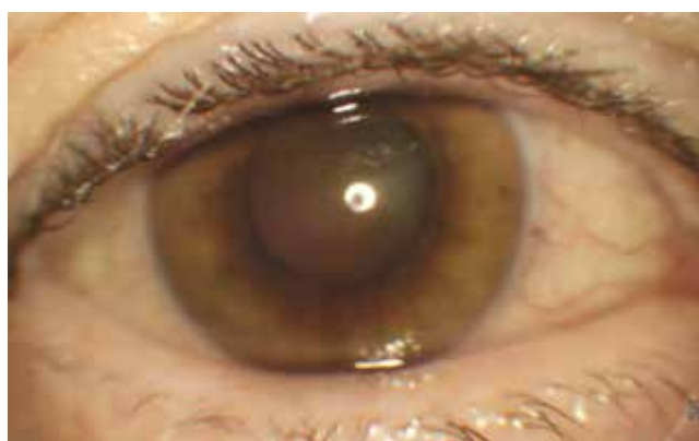
Obrázok 1. Fotografia predného segmentu pravého oka: absencia červeného reflexu, precipitáty na endoteli rohovky a prednom púzdre šošovky

prečítal 66 a 65 písmen, CRT bola 327 a 335 \mu\text{m} a vnútroočný tlak bol 20 mmHg bilaterálne. Došlo k poklesu edému makuly a ostatný očný nález bol bilaterálne bez zmeny v porovnaní s nálezom pred aplikáciou Ozurdexu®. Neboli prítomné známky zápalu a bola doplnená fokálna laserkoagulácia periférie sietnice oboch očí. Približne 3,5 mesiaca od aplikácie do pravého oka (presne 74 dní) pacient prichádza pre 10 dní trvajúce, neboleslivé zhoršenie zrakovkej ostrosti na pravom oku. Popisoval mierne zastretý obraz a prečítal 60 písmen ETDRS. Na prednom segmente bol obraz granulomatóznej prednej uveitídy (Obrázok 1). V kavite sklovca vidno tyndalizáciu zápalových buniek a formované opacity. Na očnom pozadí nachádzame zneostrený zrakový nerv, okluzívnu vaskulitídu a v periférii v temporálnom kvadrante žltobiele relatívne ostroohraničené ložisko nekrózy (Obrázok 2). Na OCT je prítomný diskretný makulárny edém, na po-