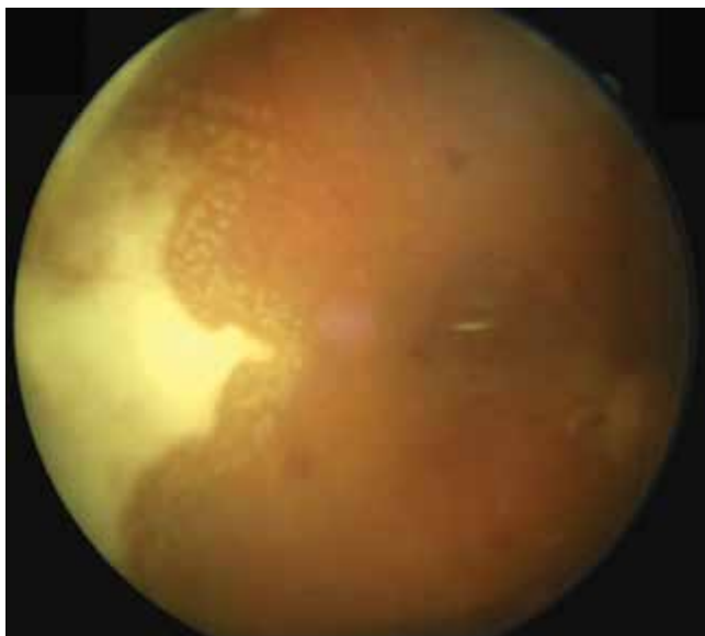
Obrázok 5. Fotografia očného pozadia pravého oka mesiac po pars plana vitrektómii

vrchu sietnice a zadnej sklovcevej membrány sú hrudky hyperdenzného materiálu (Obrázok 3).