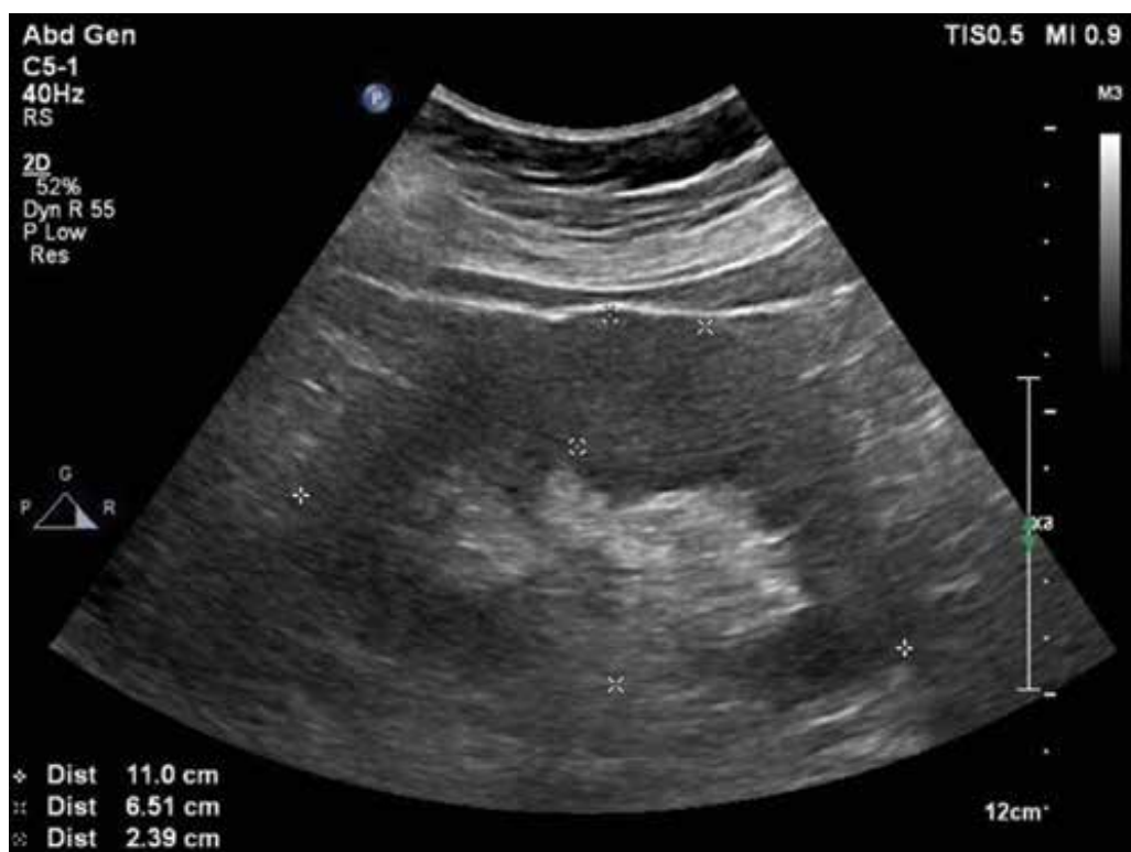
Obrázek 1. UZ ledvin – ledviny na hranici nefromegalie, parenchym 24 mm bilat.