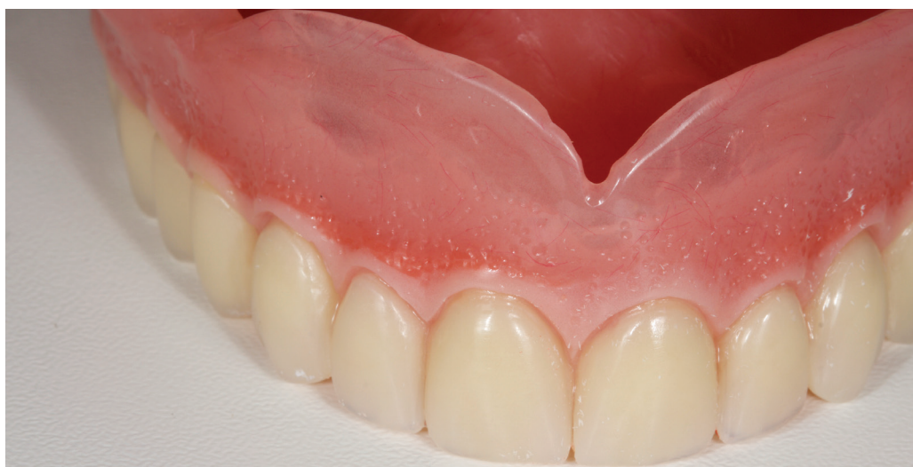
Obr. 4 Zhotovená horní totální náhrada