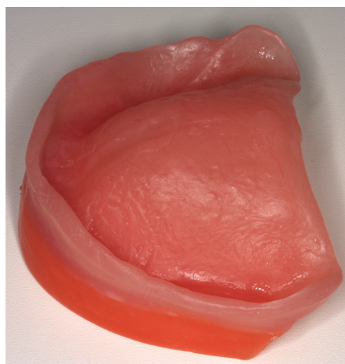
Fig. 2 Definitive basis with wax wall