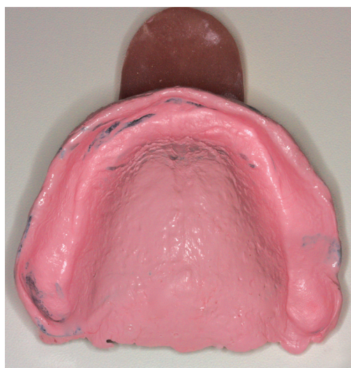
Obr. 2 Definitivní deska opatřená voskovým valem