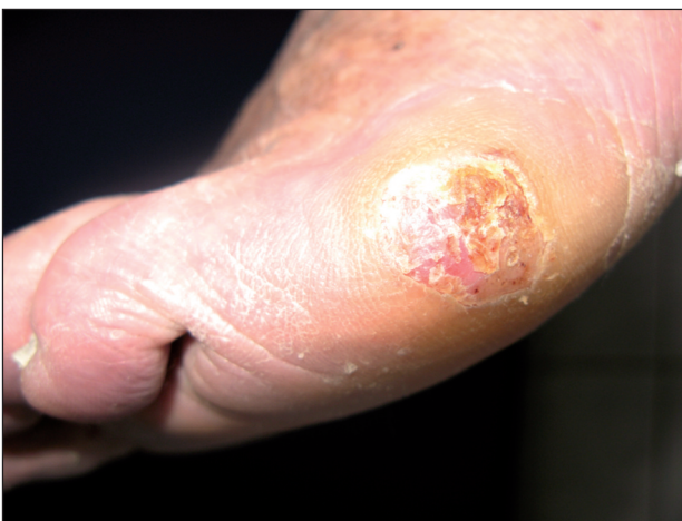
Obr. 1. Akrolentiginózní melanom, laterální strana levé nohy.

Poté byl pacient předán do naší péče k dispenzarizaci. Byla provedena screeningová vyšetření. Rentgenové vyšetření plic prokázalo postspecifické změny v horním plicním poli a v popisu ultrasonografie břicha byla difúzní jaterní léze bez hepatomegalie. Krevní testy byly v mezích normy.