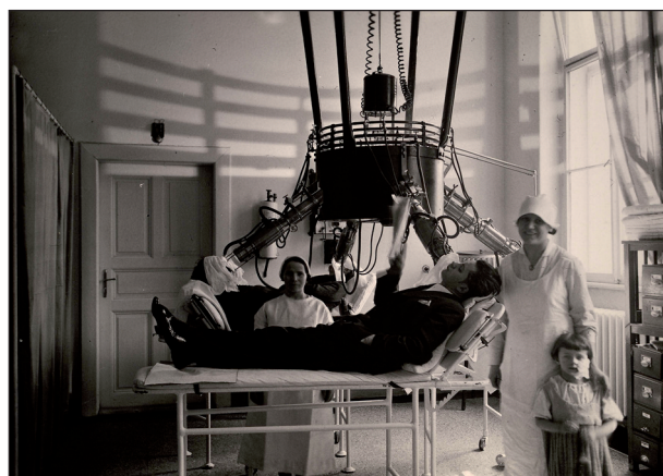
Obr. 4. Světloléčba.

Intenzivní vědecká práce a výměna nabytých poznatků