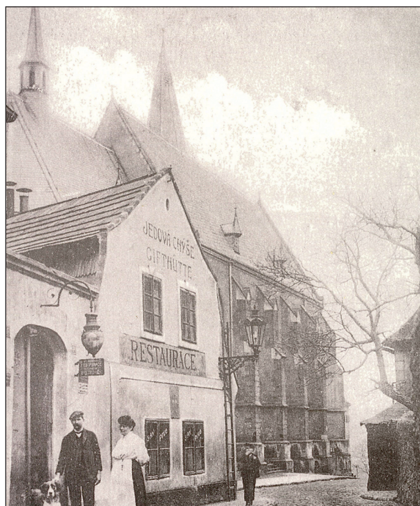
Obr. 2. Jedová chýše.

Janovský ovládal kromě češtiny a němčiny i angličtinu, francouzštinu a italštinu. Měl tak v dosahu zdroje poznání z celého kulturního světa, a ty užíval při svých výkladech studentům. V žádné klinické přednášce neslyšeli studenti citovat tolik světových lékařských autorit jako u Janovského. Nikdy se také neopomenul zmínit o „svém příteli Unnovi“. Nejlepším zrcadlem vylíčeného obrazu