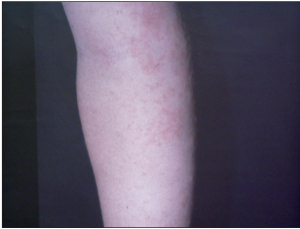
Obr. 6. Obr. 5, 6: APEC syndrom, 5-ročné dievča ( Mycoplasma pneumoniae )

strane stehna a na laterálnej strane hrudníka sa spočiatku tvoria skupiny ružových papúl s vyblednutým periférnym lemom, ďalej viac-menej ostro ohraničené ložiská ekzémového charakteru, urtikariálne, vezikulózne a purpurické ložiská postupne zasahujúce veľké plochy a nadobúdajúce anulárny charakter, v okolí s intaktnou kožou (obr. 5, 6). Lézie nezriedka svrbia.