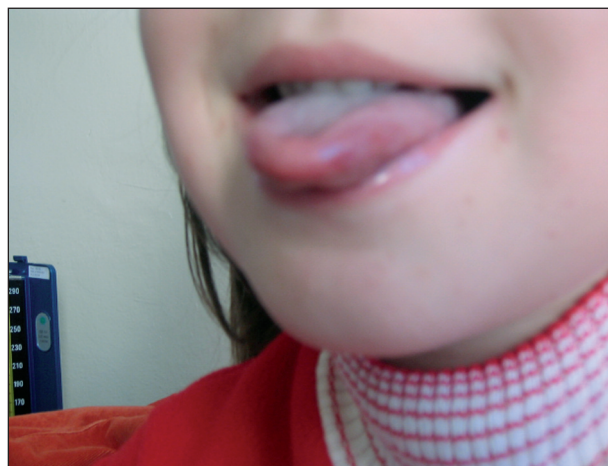
Obr. 9. Obr. 7, 8, 9: Hand, foot and mouth disease, 5-ročné dievča (enterovírusový exantém)

Atypická forma HFMD sa prejavuje tou istou klinickou symptomatológiou ako klasická HFMD, ale ulcerácie v ústnej dutine môžu absentovať. Na druhej strane možno pri atypickej HFMD pozorovať v ústnej dutine prejavy herpangíny s ulceráciami, no bez klinicky manifestnej dermatologickej symptomatológie ochorenia. V prípadoch s ťažkým priebehom až letálnym koncom sa za kritické obdobie pokladá 3.–4. deň trvania klinickej symptomatológie. Za prognosticky nepriaznivé sa považuje absentovanie ulcerácií ústnej dutiny, s výskytom makulopapulózneho alebo vezikulózneho exantému rúk a nôh, vracanie a zvýšená sedimentácia erytrocytov, niekedy aj leukocytóza a hyperglykémia. Vracanie je dôležitým príznakom upozorňujúcim na postihnutie centrálného nervového systému vo forme rozvíjajúcej sa intrakraniálnej hypertenzie v dôsledku encefalitídy zadného mozgu, osobitne ponsu. Veľmi závažná je aj symptomatológia kardiopulmonálneho zlyhania vznikajúca pri intersticiálnej pneumonitíde a myokarditíde.