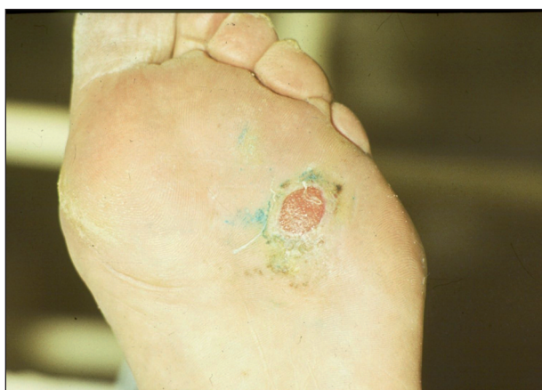
Obr. 8. Ulcus neuropathicum diabetorum .

Diabetická neuropatie je podmíněna periferní senzomotorickou polyneuropatií a autonomní senzomotorickou neuropatií. Kombinací těchto poruch vznikají nejčastěji nad hlavicí I. metatarzu nebolestivé ulcerace s hyperkeratotickým okrajem (obr. 8).