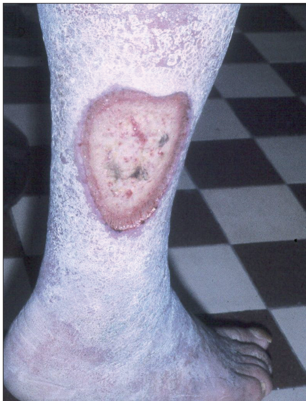
Obr. 6. Ulcus cruris hypertonicum .

Ulcus cruris hypertonicum (Martorell) je dalším typem bércového vředu cévního původu u osob s vysokým krevním tlakem. Příčinou tkáňového rozpadu jsou degenerativní změny cévní stěny a její zbytnění. Bývá obvykle lokalizován na zevní nebo přední straně bérce (obr. 6).