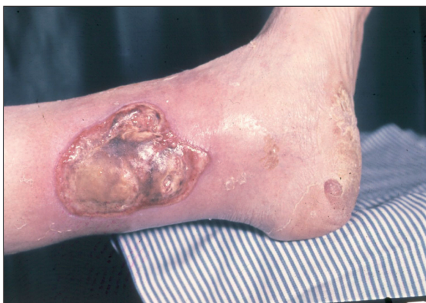
Obr. 5. Ulcus cruris arteriosum .

Trombangiitis obliterans Búrger je chronické zánětlivé onemocnění arteriálního a venózního systému dolních končetin, které vede ke gangrénám, nekrózám a ulceracím