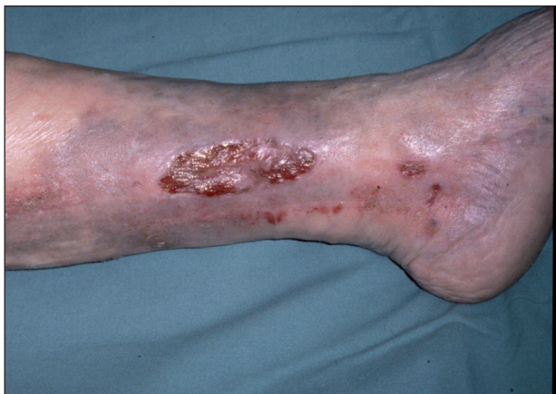
Obr. 4. Ulcus cruris venosum .

Bércové vředy posttrombotické bývají hluboké, rozsáhlé, často cirkulární s podminovanými okraji, s povleklou a výrazně exsudativní spodinou. Kožní změny v okolí jsou výraznější, zejména otok, který se záhy mění v tuhý – skleredém. Posttrombotické ulcerace se rovněž vyskytují ponejvíce v dolní třetině bérce, v oblasti, která se označuje jako „kamašovitá“ zóna.