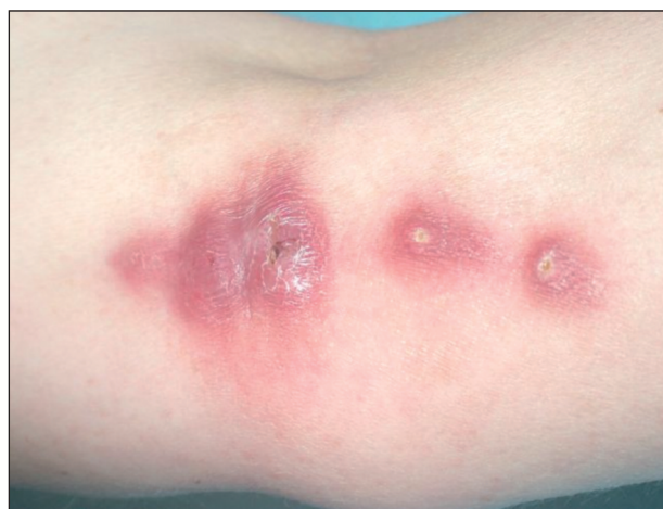
Obr. 2. Abscedující noduly na vnitřní oblasti lokte.

Postupně došlo k odchlípení nehtové ploténky, ke spontánní ablacii však nedošlo. Následně vznikl červený nebolestivý nodulus na dorzu ruky. Pro výraznou bolestivost prstu navštívila v 1/07 chirurgickou ambulanci, kde byl lokálně aplikován Višněvského balzám. Vzhledem k přibývání nebolestivých nodulů navštívila spádového dermatologa. Byla léčena antibiotiky lokálně a celkově (2 měsíce Deoxymykoin, 1 měsíc Augmentin), avšak bez efektu. Většina nodulů hojně produkovala hnisavý sekret. Aerobní a anaerobní kultivace byly negativní. V 5/07 byla na chirurgické ambulanci provedena exstirpace prvního nodulu z dorza ruky a tkáň byla poslána k mikrobiologickému vyšetření. Poté byla pacientka odeslána k vyšetření na naše pracoviště.