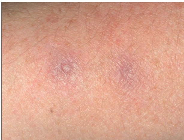
Obr. 6. Přetrvávající lividní erytémy po zhojení projevů na předloktí.

V histologickém nálezu byly patrné granulomy. Léčbu snášela pacientka velmi dobře, pravidelně byly prováděny oční kontroly a základní laboratorní vyšetření krve. Po odstranění posledního nodulu v 6/08 byla léčba ukončena.