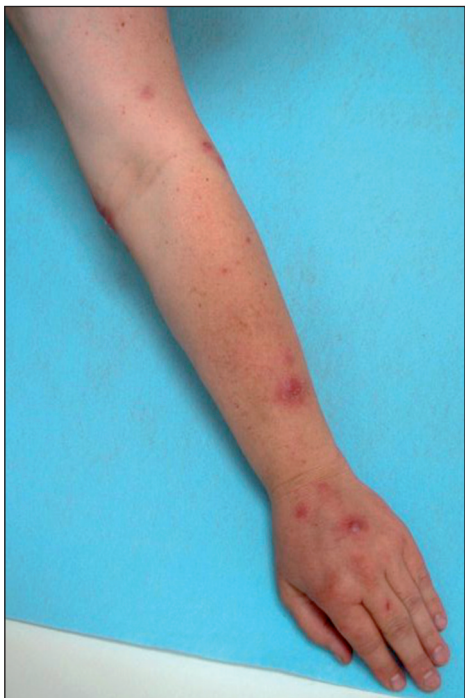
Obr. 1. Noduly na levé horní končetině.

Pacientkou je 53letá žena s nevýznamnou rodinnou anamnézou. V osobní anamnéze pacientka uváděla hypertenzi a artrózu, pro kterou jí byly provedeny úplné náhrady kyčelního a kolenního kloubu. Trvale užívá antihypertenziva. Pacientka chovala akvarijní ryby. V 12/06 čistila bez rukavic akvárium a jemně se píchla o hřbetní ploutev chovaného sumečka do špičky prostředníku levé ruky. V tomto období jí uhynulo několik ryb s kožními ulceracemi, deformací těla, vzdučným břichem a exoftalmem, což jsou vysoce suspektní příznaky při mykobakteriálním onemocnění akvarijních ryb. Za 2–3 týdny si pacientka všimla zarudnutí distálního článku poraněného prstu.