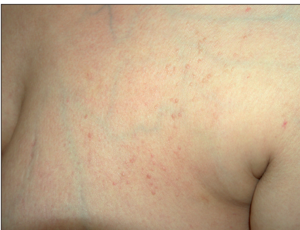
Obr. 2. Lichen amyloidosus – laterální strana hrudníku.