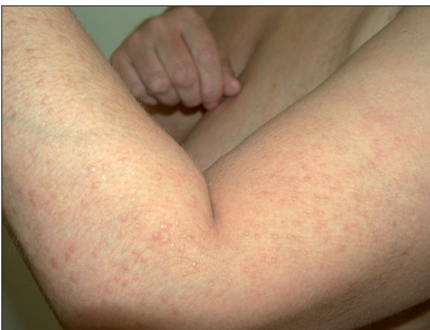
Obr. 1. Lichen amyloidosus – laterální strana levého předloktí a paže.