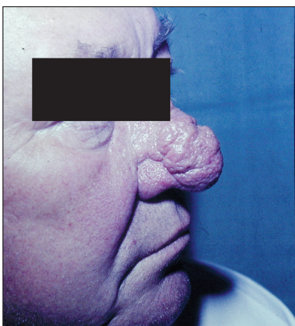
Obr. 4. Rhinophyma.

ní, řezání, svědění, nesnášenlivost světla. Dále může být přítomna hyperémie spojivek, blefaritida, konjunktivitida, teleangiektazie a nepravidelnost okrajů očních víček (3, 43). U některých pacientů může dojít k poruchám vizu následkem postižení rohovky (keratitis). Často se objevuje chalazion nebo hordeolum (43). Oční postižení může předcházet kožní změny řadu let – dle některých studií zhruba u 20 % pacientů s okulární rozaceou se objevuje oční postižení před kožní manifestací (43). Asi u poloviny pacientů jsou nejprve přítomny kožní změny a teprve potom dochází k očnímu postižení (43). Proto by každý pacient s kožními projevy rozacey měl být vyšetřen oftalmologem. Oční rozacea bývá často poddiagnostikována a je léčena pod jinými diagnózami, často nevhodnými antibiotiky.