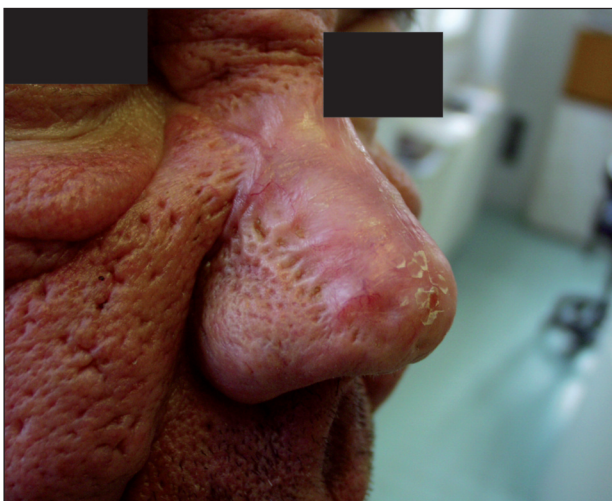
Obr. 4. Rhinophyma – stav před operací (a) a po zhojení (b)