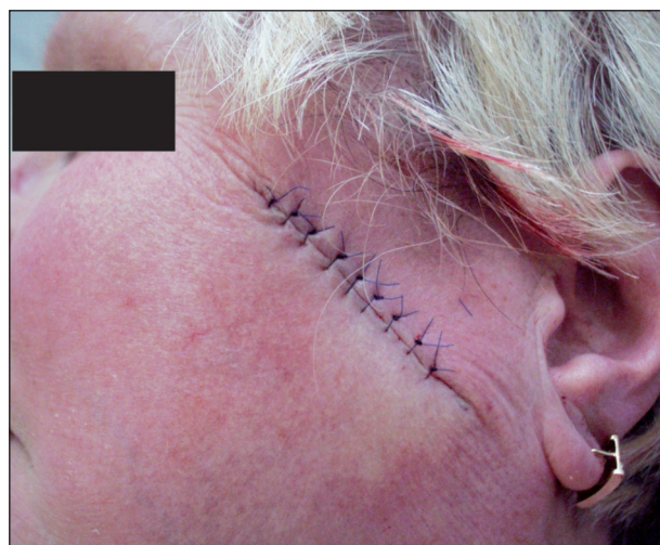
Obr. 1. Rána uzavřená primární suturou jednoduchými uzlovými stehy.

Primární sutura je nejčastěji využívaným uzávěrem operační rány v kožní chirurgii (obr. 1). Nevhodnější tvar excize uzavírané primární suturou je tvar vřetenovitý, člunkovitý. Poměr délky excize k její tloušťce by měl být 2–3:1, s úhlem asi 30°. Podélná osa excize by měla, je-li to možné, respektovat průběh tzv. ohybových linií (RSTL – relaxed skin tension lines). V nich lze nejlépe skrýt následnou jizvu. Průběh těchto linií v podstatě odpovídá