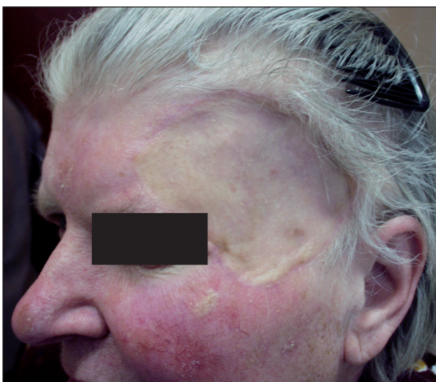
Obr. 3. „Záplata“ po přihojení transplantátu plné kůže.

Kožní transplantát (7) přichází při uzavěru rány v úvahu obvykle až jako poslední možnost, když primární sutura, místní lalok ani ponechání rány ke spontánnímu hojení nejsou vhodné nebo možné. Transplantát je zvažován většinou jako poslední možnost zejména z kosmetických důvodů, neboť obvykle zanechává nápadnou „záplatu“, zvláště pokud odebraná kůže je výrazně odlišná od kůže v místě aplikace (obr.3). Nevýhodou metody je i vznik druhé rány v místě odběru transplantátu, kterou je nutno uzavřít nebo jinak ošetřit. Přesto má použití transplantátu i své nesporné výhody. Provedení je technicky jednodušší než u většiny místních laloků a lze jím spolehlivě kryt téměř každou ránu, která má dostatečně vaskularizovanou spodinu. Výběr dárcovských míst je dosti širo-