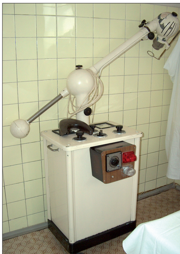
Obr. 3. Buckyho přístroj.