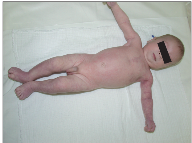
Obr. 3. Celkový pohled.

V současnosti je chlapci 20 měsíců, je pravidelně sledován neonatologem, neurologem, ortopedem a očním lékařem. Dosud nebyla diagnostikována žádná z asociovaných abnormalit. Zpomalený psychomotorický vývoj výrazně postoupil, neurolog konstatuje jen opožděný nástup řeči. Kožní nález zůstal nezměněn, asymetrie končetin je stacionární.