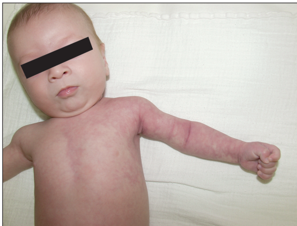
Obr. 1. Postižení na horní končetině a hrudníku.

Během vyšetření ve věku 3 měsíců jsme na dermatovenerologické klinice pozorovali výraznou retikulární cévní kresbu červenofialové barvy na obou horních i dolních končetinách a přilehlých segmentárních částech hrudníku s ostrým ohraničením nad sternem – obrázky 1, 2 a 3. Zaznamenali jsme asymetrii končetin, levá dolní končetina byla o 0,5 cm delší než pravá a výrazně hypotrofická ve srovnání s pravou dolní končetinou. Ostatní kožní nález byl fyziologický.