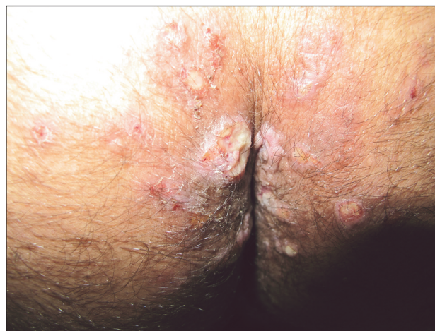
Obr. 3. Condylomata lata u HIV pozitivního pacienta

stádia mohou vykazovat nodulo-ulcerativní charakteristiky. Z klinických symptomů vedle klasických projevů (obr. 3 – Condylomata lata u HIV pozitivního pacienta) byla popsána palmoplantární keratodermie jako projev sekundární syfilis [66]. Častěji bývají popisovány i oční a ušní manifestace syfilis u HIV pozitivních pacientů [68]. Postižení CNS se může objevit podstatně dříve , a to dokonce u primární syfilis [6]. Doporučovaná terapeutická schémata nemusí být dostatečná v terapii a v prevenci CNS postižení: Poukazuje se i na možnost časných relapsů CNS postižení i po standardní terapii, pravděpodobně díky kombinaci alterované buněčné imunitní odpovědi při HIV infekci a nedostatečným hladinám účinného léčiva v CNS [6]. Jarisch-Herxheimerova reakce při terapii syfilis bývá častější. Před započítím terapie neurosyfilitické infekce musí být řádně vyšetřen mozkomíšni mok u všech HIV pozitivních osob s latentní syfilis delší než 1 rok nebo neznámé délky trvání.