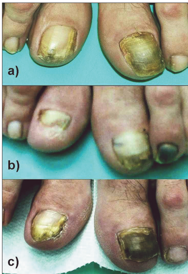
Obr. 1. Nechty palcov nôh pacientky č. 3 s potvrdenou scedospóriovou onychomykózou