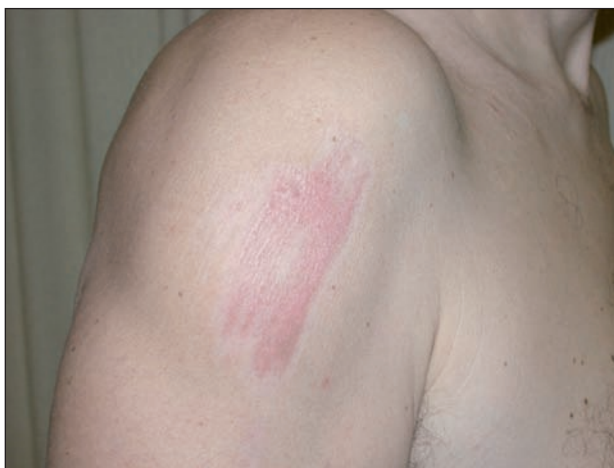
Obr. 2. Pacient měsíc po zranění

Pacient (51 let), zdravý, alergiemi netrpící sportovně založený lékař se při šnorchlování v Rudém moři škrábl na pravém rameni o drsný povrch korálového útesu. Po 5–10 minutách udával silné pálení. Po ošetření masť s 0,5% prednisolonu a 3% clioquinu a roztokem 10% jód-polyvidonu došlo k úlevě. Během dalšího pobytu u moře po dobu 5 dnů při koupání ve slané vodě rána silně štípala, nicméně neomezila aktivity pacienta včetně slunění při aplikaci SPF 50+. Pacient se od návratu domů léčil nepravdělnou aplikací kortikosteroidních extern – za měsíc bylo ložisko stále zarudlé, sestávající z lineárně uspořádaných splývavých lesklých červenohnědých makulopapul, citlivé na pohmat (obr. 2). Během dalšího měsíce došlo k postupné regresi klinických projevů. Za dva roky byly stopy po zranění stále zřetelné s depigmentací a hypertrofickou plošnou jizvou, i když postižený tvorbou hypertrofických nebo keloidních jizev netrpí.