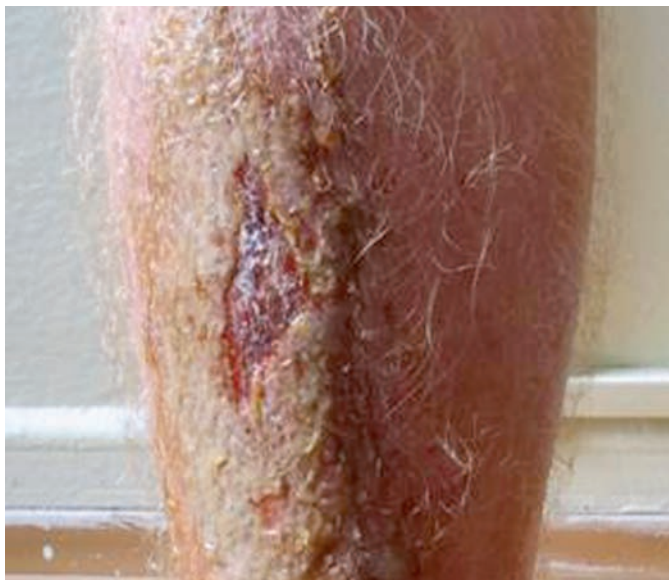
Obr. 1. Predkolenie

javy úporne svrbeli a pacient si ich škriabal. Objektívne bol na pravom predkolení prítomný erytém a edém polotuhej konzistencie siahajúci od dorza pravej nohy pod pravé koleno, na pohmat koža teplejšia oproti ľavému predkoleniu (obr. 1).